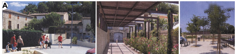
A, 1 - Parking Voltaire. B, 2 et 3 - Place des Etats du Languedoc. C - Rue Anatole France (avant - après).